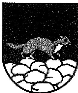
Obrázok 1 Erb Obce Ubl'a

Erb obce: Erb obce zobrazuje kunu skákajúcu po hrbe skál.